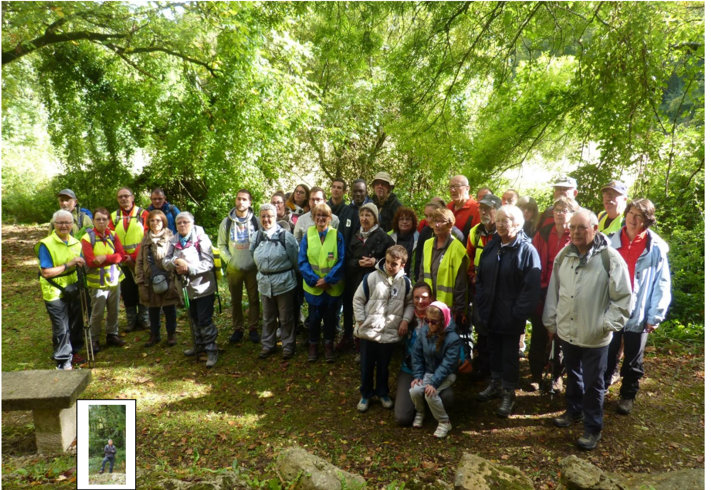
Le groupe solidaire !