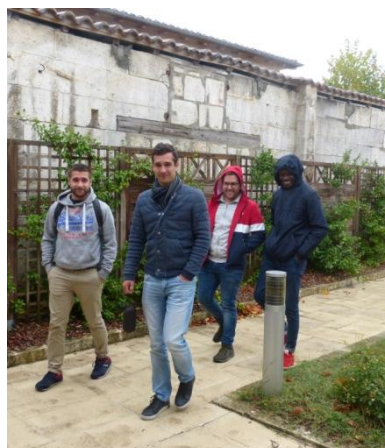
Arrivée des « anciens »