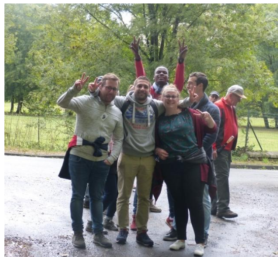
et la séparation : circuits 4 ou 8 kms

Le temps était également solidaire : Un grand soleil d'automne et même un arc en ciel nous ont encouragés. Les parcours ont permis d'apprécier les charmes (et les chênes, néfliers...) de la nature, les méandres de la boëme, les tourbières et la belle architecture (logis de Bournet...)