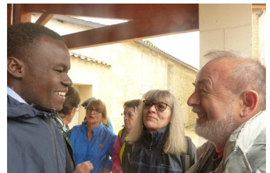
Discussions avec l'ambassadeur du Burkina