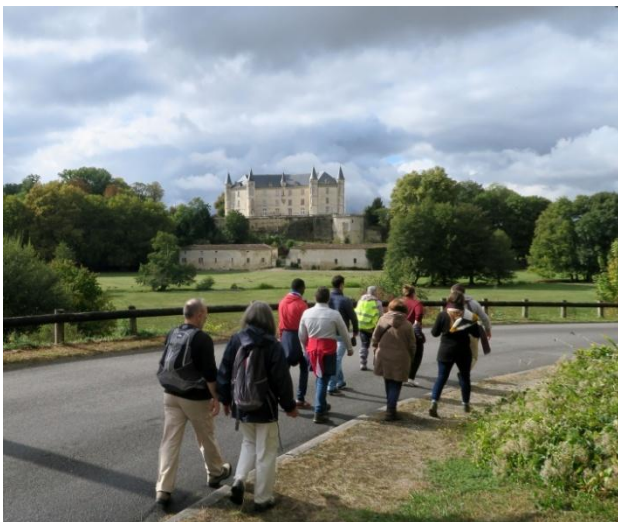
Le château de La Rochandry et son chemin de traverse célèbre à Mouthiers